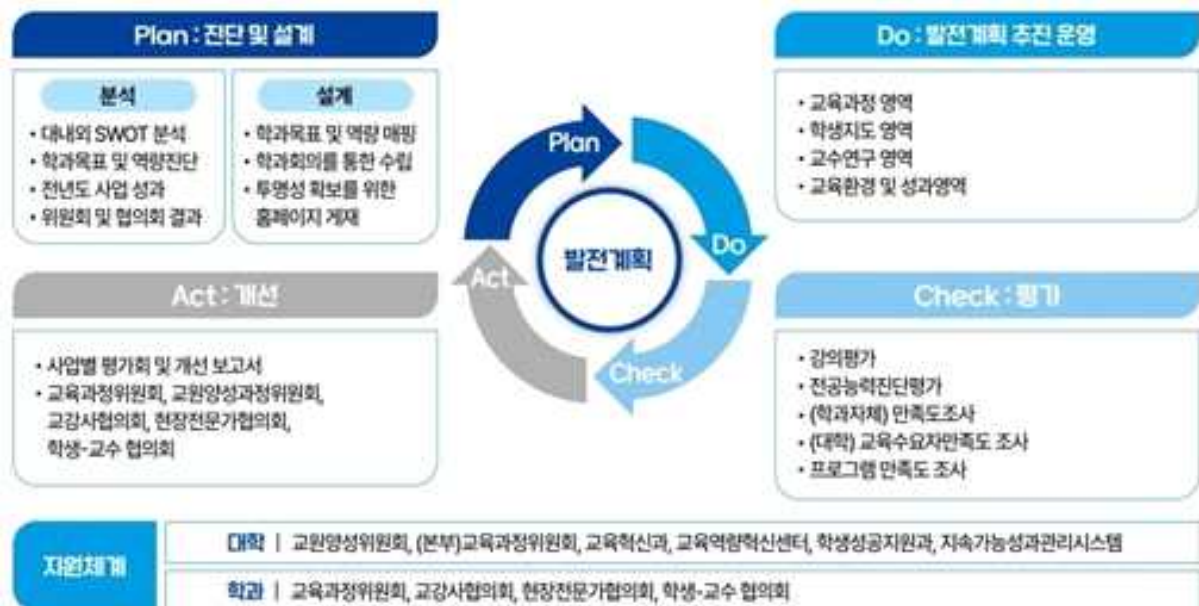
<그림> 학과 발전계획 수립 및 환류 체계